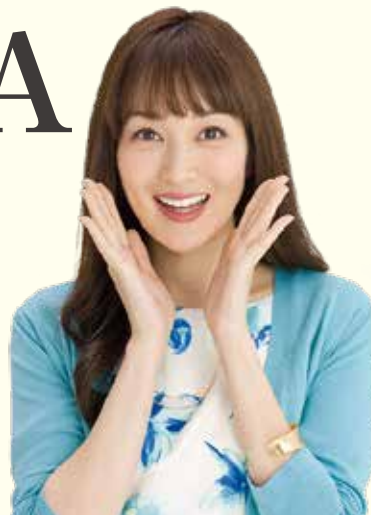
ろうきんイメージモデル 高梨臨